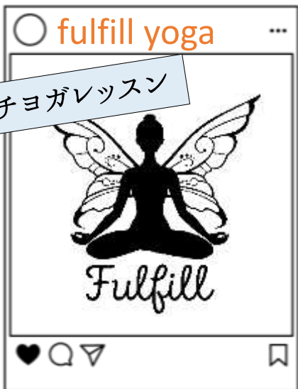
プチヨガレッスン