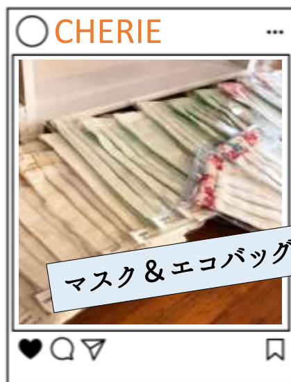
マスク & エコバッグ