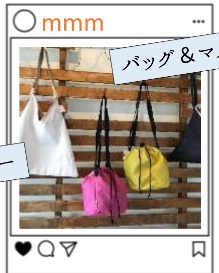
バッグ & マスク