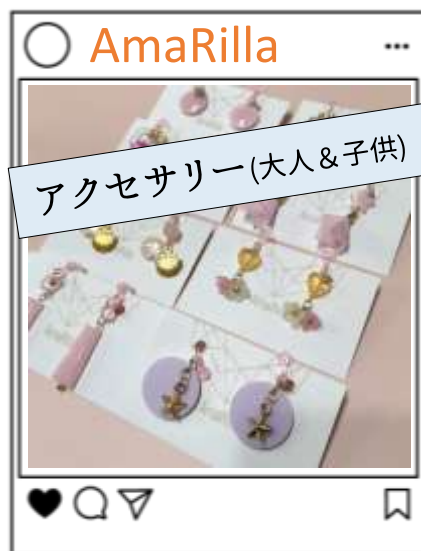
アクセサリ(大人&子供)