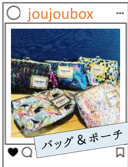
バッグ & ポーチ